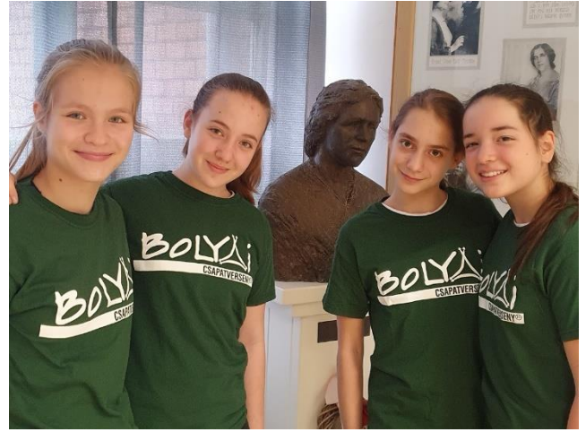
DODEKAÉDEREK 6. b