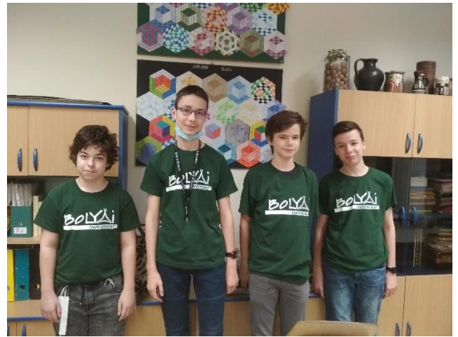
HÁPISZ UNOKÁI 8. b – 8. c