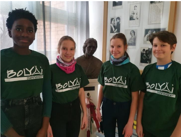
OKOS BAGLYOK 7. b